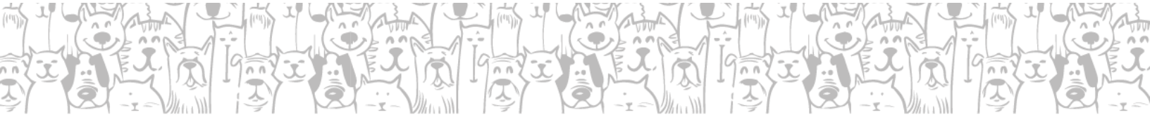
TABELA DE CUSTOS REFERENCIADA: Trata-se de uma relação, detalhada, com os procedimentos elencados pelo CRMV, com os custos referenciados para cada serviço, e que servirá de base para reembolso, em caso da opção do Cliente por utilizar uma clínica de sua preferência.

O e-mail adequado para envio é o atendimento@amigoopet.com.br